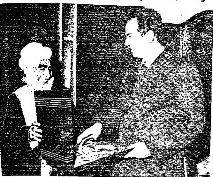
معالي محمد بن احمد يقدم هدية لثلاث الرئيس العراقي